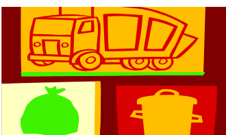
2. Sperrmüll- und Alteisenentsorgung 17. Oktober 2014